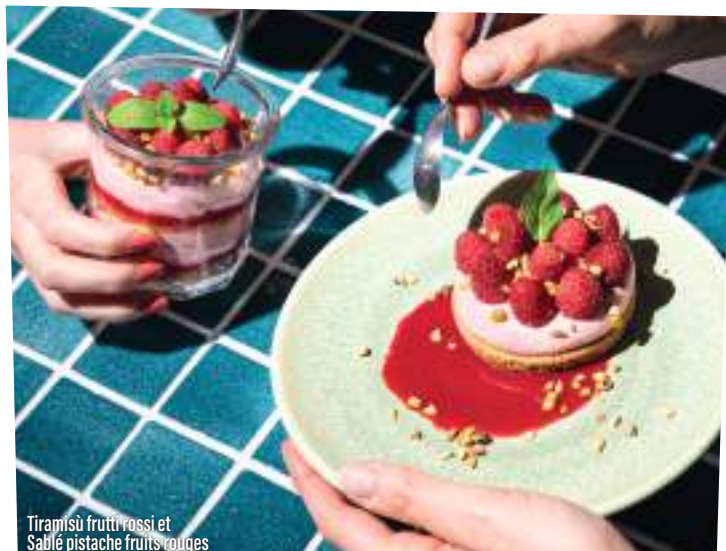
Tiramisù frutti rossi et Sablé pistache fruits rouges