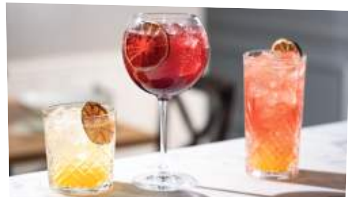
Italicus Mule, Kiss Spritz, Vibranza

Jus d'orange, purée de cerise, concentrés de fruits rouges et de citron vert, 20 cl