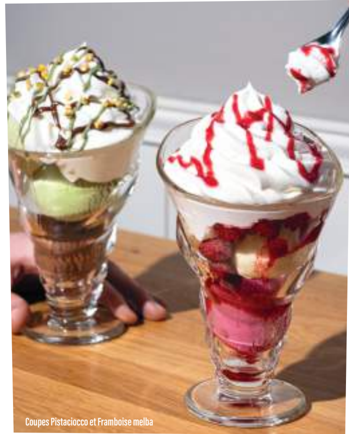
Coupes Pistacchio et Framboise melba

TOUS NOS SORBETS ET CRÈMES GLACÉES SONT PRODUITS EXCLUSIVEMENT POUR DEL ARTE.