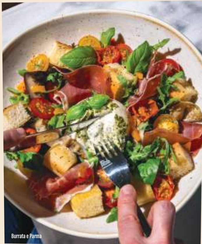
Burrata e Parma