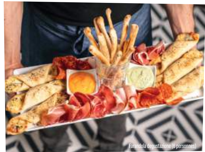
Farandola degustazione (6 personnes)