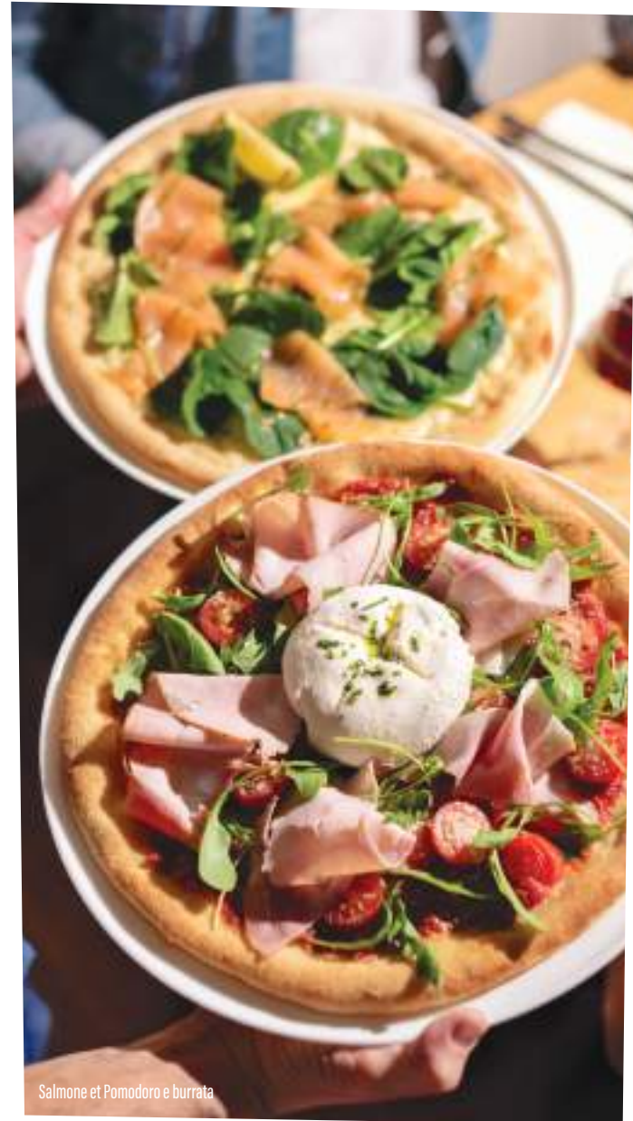
Salmone et Pomodoro e burrata

FANS DE CALZONE ? SAVOUREZ LA REGINA, LA TUTTI FORMAGGI ET L'INCONTOURNABLE CAESAR !