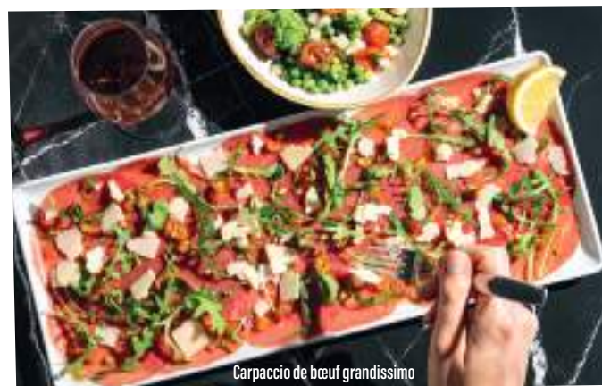
Carpaccio de bœuf grandissimo