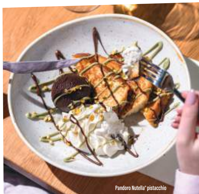
Pandoro Nutella® pistacchio