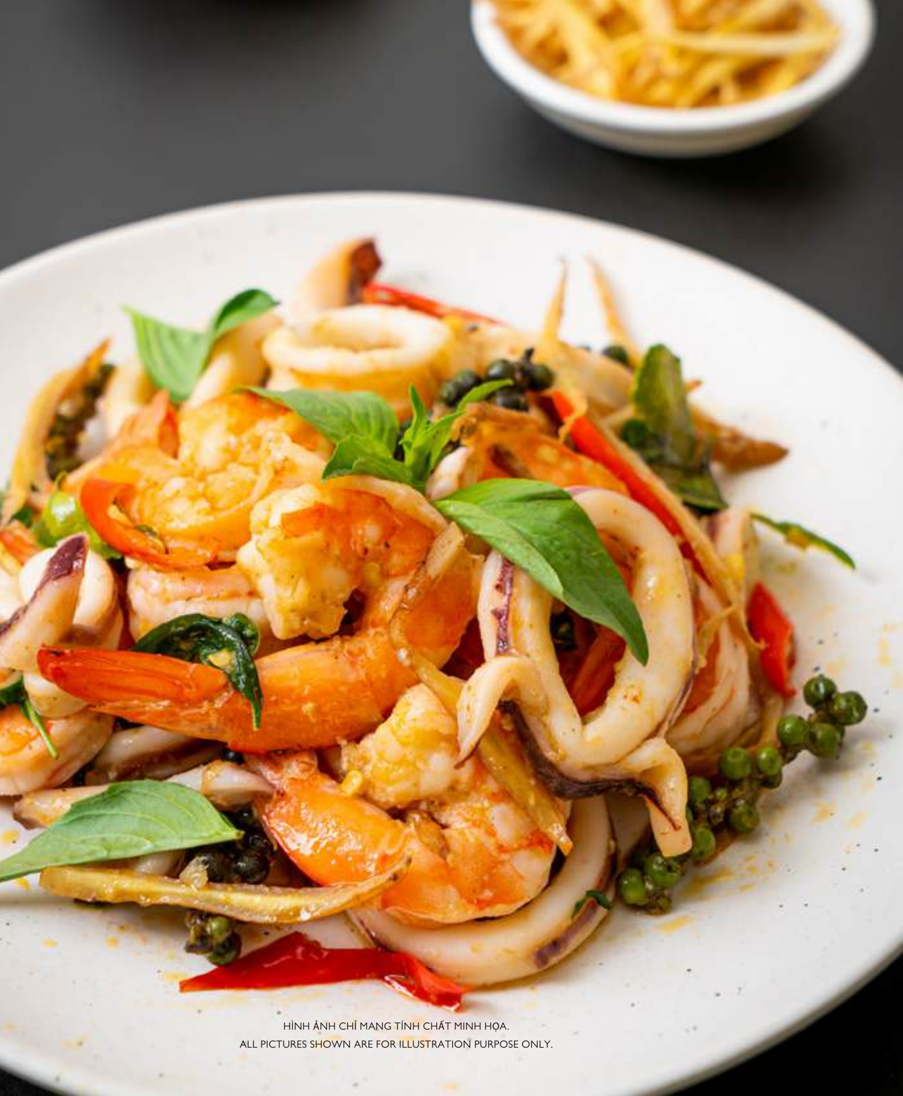
HÌNH ẢNH CHỈ MANG TÍNH CHẤT MINH HỌA. ALL PICTURES SHOWN ARE FOR ILLUSTRATION PURPOSE ONLY.