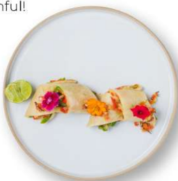
• Tortilla Vegetable Wrap 320++ THB

Vegetables are packed with ANTI-OXIDANTS like Vitamin C and E, folic acid, lycopene, and more, keeping your body healthy and feeling youthful!