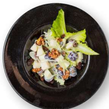
• Waldorf Salad 280++ THB