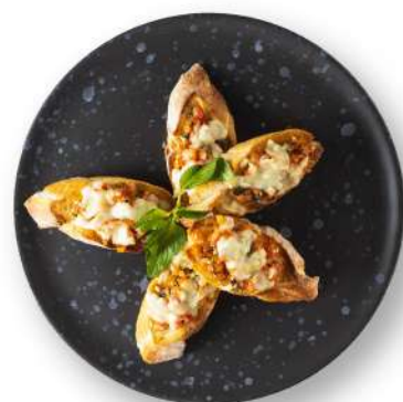
• Bruschetta 300++ THB

Kindly inform us if you have any allergic intolerance, dietary restrictions, food allergies, or specific dietary preferences, such as vegetarian or halal, to ensure we can accommodate your needs accordingly.