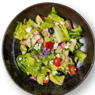
• Blue Cheese Salad 300++ THB