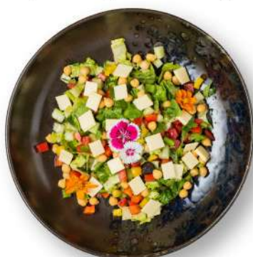
• Chopped Salad 360++ THB